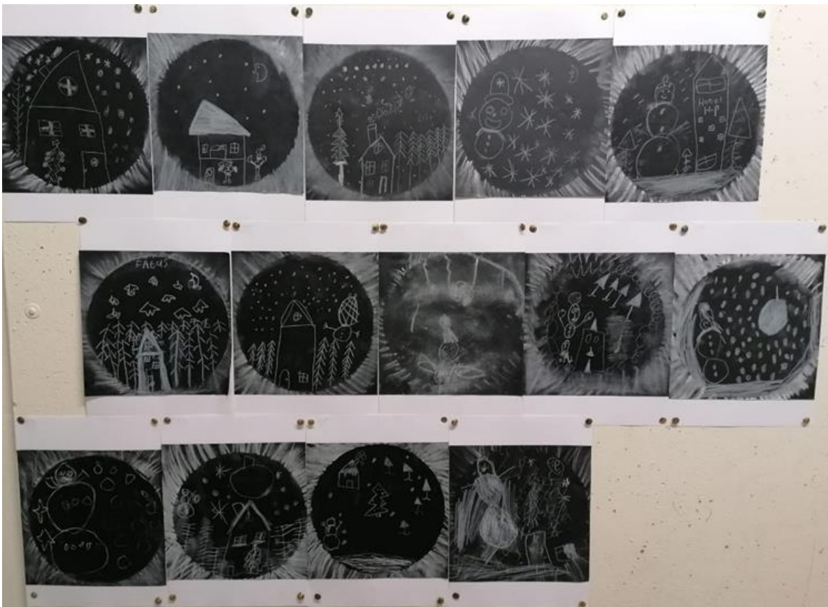
Winterte- keningen van de groep IJsbeer