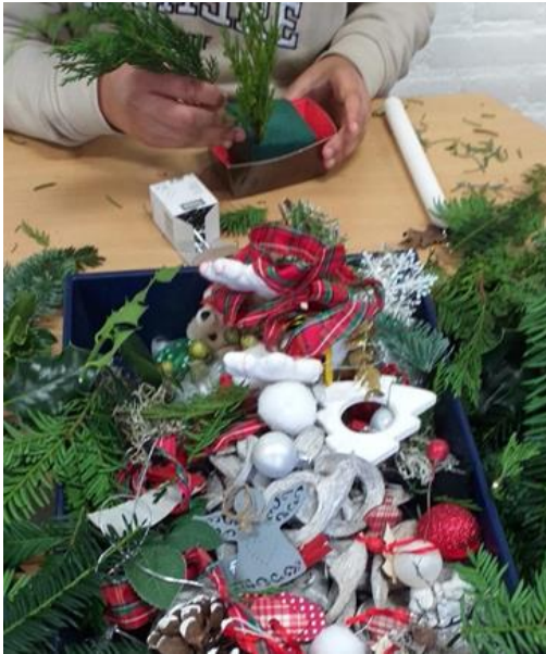
Kerststukjes maken bij de groep Octopus.